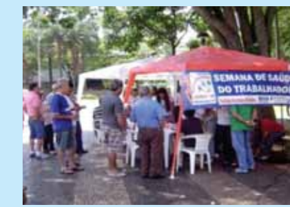
Projeto - Construindo a saúde do trabalhador

Tem por objetivo homenagear a categoria, em comemoração ao seu dia, caminhar juntos e reivindicar direitos como: regulamentação da profissão do comerciário, redução da jornada de trabalho sem redução dos salários, fim do trabalho aos domingos e feriados, equiparação dos direitos entre homens e mulheres, erradicação do trabalho infantil e fim do fator previdenciário, entre outras reivindicações. Esta caminhada é realizada no mês de outubro no Parque do Sabiá.