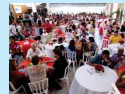
Festa 1º de maio

Tem por objetivos estreitar os laços, fortalecer a união da categoria e comemorar esta data especial, visto que nós, os trabalhadores, é que realizamos o progresso e o desenvolvimento de nosso país.