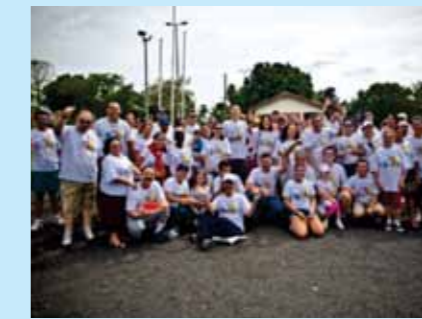
Caminhada do Comerciário

Realizada no mês de maio, participam trabalhadores do comércio atacadista e varejista de Uberlândia e Araguari, desde que tenham vínculo empregatício no segmento do comércio. Este evento é promovido pelas seguintes entidades: SECUA, e SESC Serviço Social do Comércio MG.