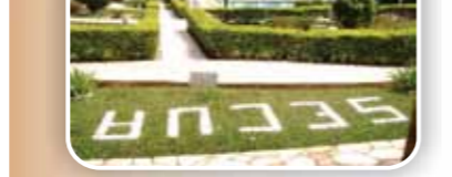
Recanto do Comerciário